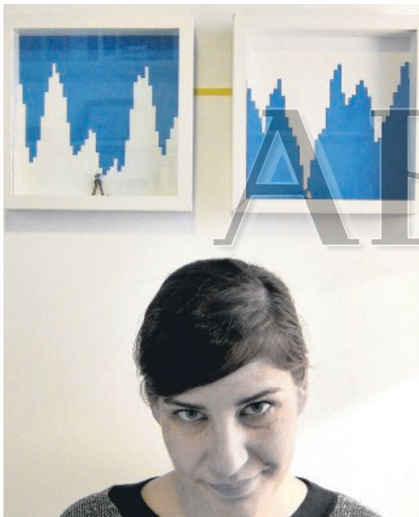
La autora con dos de las piezas que el visitante encontrará en la galería ABC

► La joven exhibe en C-aps (Plaza Puerta Real, 8) su exposición «Miniencuadro», donde la artista ofrece su visión del mundo en pequeñas escenografías. Hasta el 10 de diciembre